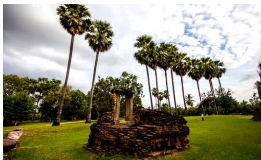
ปราสาทภูมิโปน ประกอบด้วย